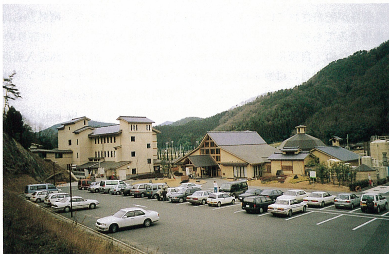
写真2 但東シルク温泉館全景 (左方に町営宿泊施設やまびこの新館が見える)