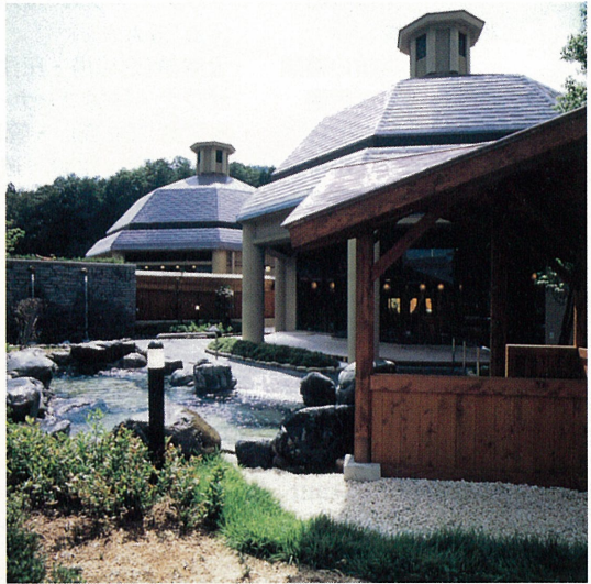
写真3 山の湯（露天風呂）