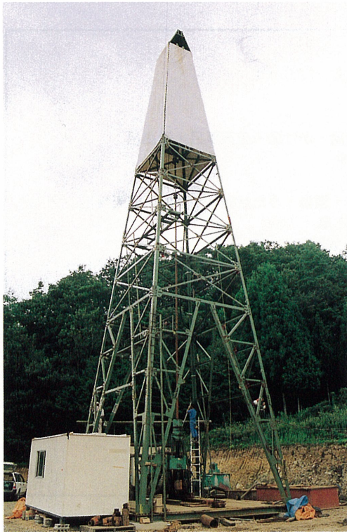
写真1 但東シルク温泉の掘削が完了し揚湯試験の準備をしている状況