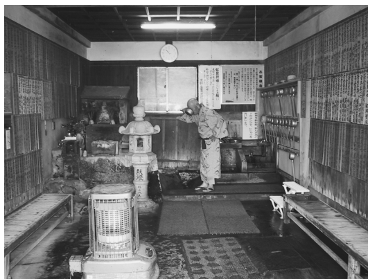
Photo 2-2 Inside view of the shed.