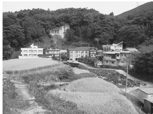
Photo 1 An overview of Tsukano-spa.

2001年8月29~30日および9月25~30日の延べ8日間にわたり, 塚野鉱泉の旅館AおよびBに滞在し, 参与観察 註2) と聞き取り調査を実施した. 参与観察では, 筆者ら自身が湯治客となり湯治活動を体験するとともに