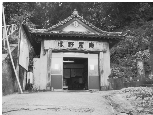
Photo 2-1 A shed for drinking water.

飲泉場には、少ない時間帯で 3, 4 人、多い時間帯だと 10 人前後の湯治客が居合わせていたが、客同志の会話は「下りましたか?」、すなわちもう下痢をしたかどうかを挨拶に、自分の病気・健康についての話題や世間話を中心になっていた。また、新参の湯治客に対しては、飲泉法とその効果についてきわめて熱心な“指導”が行われていた。ちなみに、筆者らは、鉱泉のあまりの飲みにくさに、初日には柄杓一杯を飲むのがやっとで下痢をするには至らなかったが、そのことを話すと、湯治客から、「そんなことでは病気は治らな