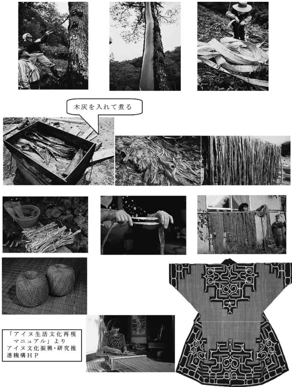
図2 アットウシ（樹皮衣）の製作

その中でもアイヌ（人間）とカムイ（神）との互惠関係が、世界の基本を成すと言われる。ここでいうカムイ（神）とは唯一絶対の存在を意味するものではない。アイヌの世界観では、すべてのものが精神性を有し、その中でも力の強いものをカムイと呼ぶ。したがって有用性の高い動物や植物はもちろん、雷や疫病神などもカムイとみなされた。このような世界観をよく示すものとして