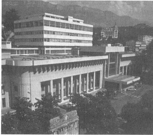
国立温泉治療施設(正面玄関)

国立の温泉には、世界でも例をみないようなユニークなものや古いものも含めて、20以上の技術があります。マッサージ・シャワーは、全身マッサージと組み合わせて鉱泉水を使用して、マッサージ効果のあるシャワーをひとつかふたつ動かしておこなわれます。ベルトレと呼ばれる技術は鉱泉蒸気を全身または、とくに牛などの身体の一部にあてる方法を言います。